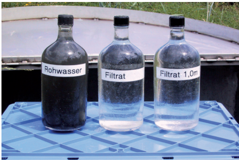
Strassenabwasser unbehandelt und nach Durchlaufen eines Sandfilters