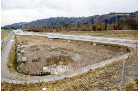
SABA Rubigen mit dem östlich der Autobahn gelegenen Sandfilterbecken