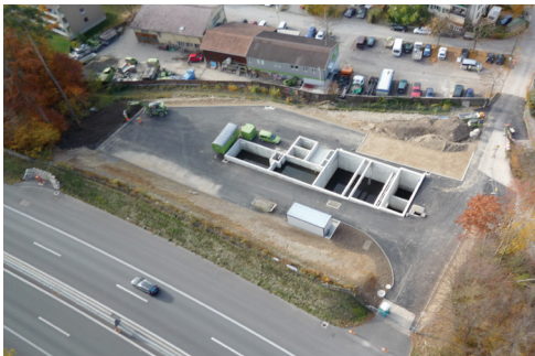
Technische SABA bei Bern-Bümpliz

In den südlichen Ein- und Ausfahrtsschleifen des Autobahnanschluss Rubigen befindet sich neu eine SABA, welche das auf der Autobahn anfallende Strassenabwasser reinigt.