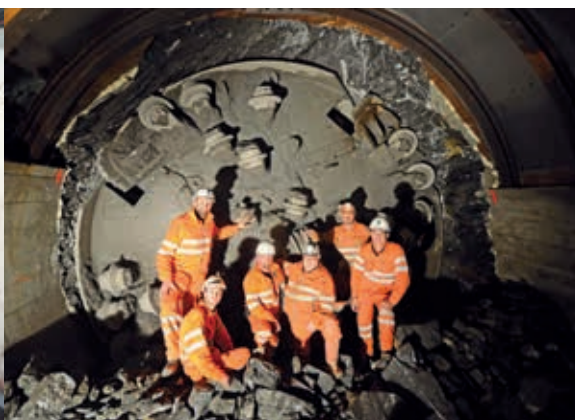
Die Tunnelbohrmaschine ist in den alten Fluchtstollen des Giessbachtunnels eingefahren.