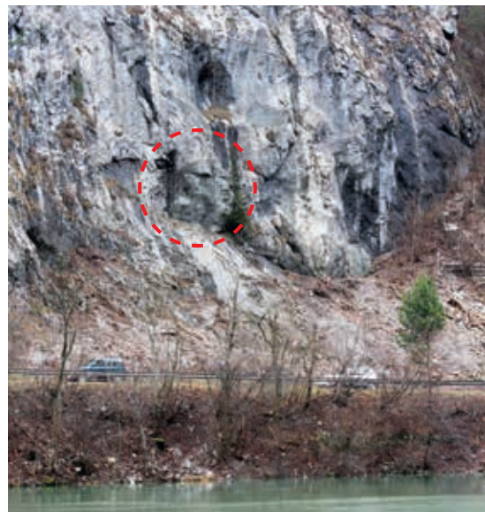
Blick von Süden zum Standort des künftigen Stollenportals; der historische Militärbunker (rot eingekreist) ist gut getarnt. Das Fluchtstollen-Portal entsteht direkt darunter an der Kantonsstrasse.