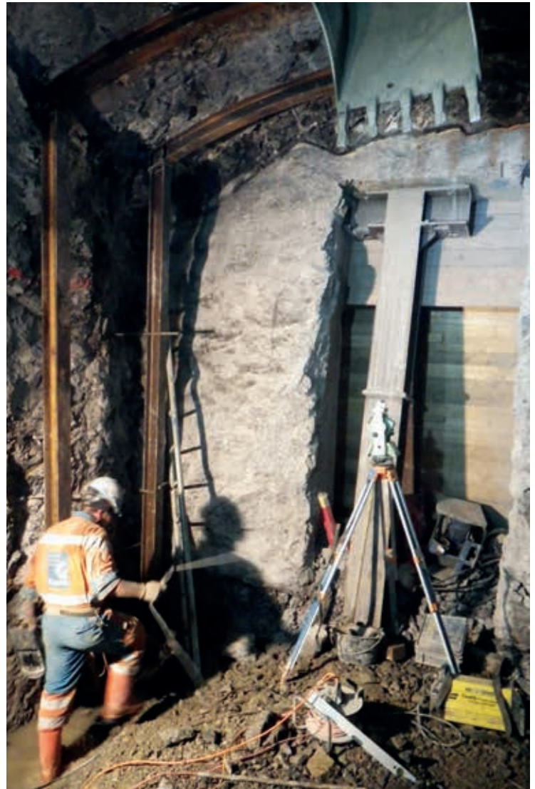
Anschluss des Fluchtstollens Sengg an die Hauptröhre

Beim Chüebalm-Rettungsstollen konnte dieser Meilenstein bereits erreicht werden: Ende Februar feierten die Mineure den Durchschlag. Die 1,3 km lange Röhre ist im Sprengvortrieb ausgebrochen worden. Bis im Sommer werden nun die künftige Sohle eingebaut und die Wände verkleidet, anschliessend werden die Schleusen und die Portale eingebaut.