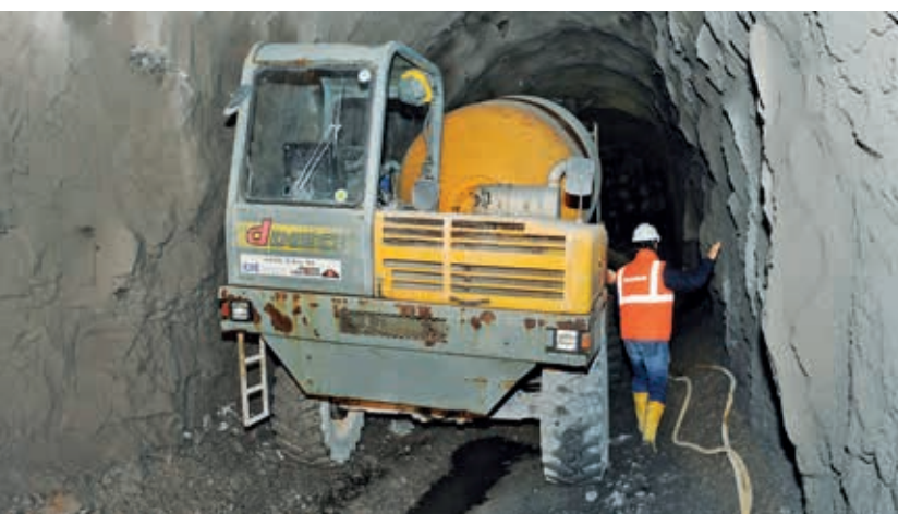
Bau einer der Querverbindungen zwischen dem Sicherheitsstollen des Chüebalm-Tunnels und der Hauptröhre

Am weitesten fortgeschritten sind die Arbeiten beim Senggtunnel. Weil dieser mit seinen 870 Metern relativ kurz ist, wird er nicht mit einem parallel zur Hauptröhre angelegten Sicherheitsstollen ausgestattet, sondern mit einem Fluchtstollen, der von der Tunnelmitte ins Freie führt. Der Stollenausgang liegt rund 20 m über dem Niveau des Strassentunnels. Daher kam hier ein ganz anderes Bauverfahren zum Einsatz. Zunächst wurde von oben nach unten ein vertikaler Schacht gebaut, danach von dessen Grund aus die Querverbindung zur Tunnelröhre ausgebrochen. Der Durchschlag erfolgte letzten November. Seither sind die Stollenwände verkleidet und eine Stollensohle eingebaut worden. Bis im Sommer wird im Schacht eine Betontreppe installiert und danach über dem Schacht ein Abschlussbauwerk errichtet.