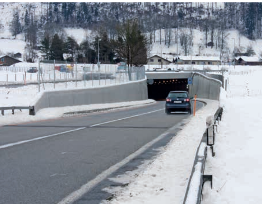
Winterpause bald zu Ende: In den nächsten Tagen beginnen die diesjährigen Arbeiten in der Lüttschinenunterführung.

In den nächsten Tagen werden die Arbeiten zur Sanierung der Lüttschinenunterführung wieder aufgenommen. Im Rugentunnel sind die Arbeiter bereits am Werk. In der zweiten Jahreshälfte wird in beiden Tunnels vor allem an der Betriebs- und Sicherheitsausrüstung gearbeitet.