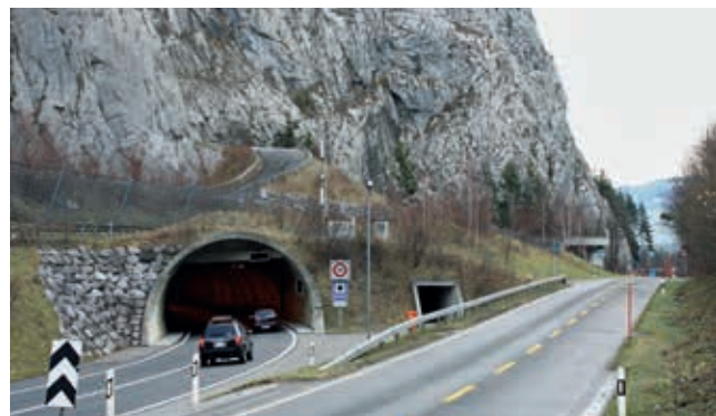
Das Westportal des Simmenfluh-tunnels; rechts von der Nationalstrasse verläuft die Kantonsstrasse.

Es gibt mehrere alte Bunker an der Simmenfluh. Einer davon liegt direkt oberhalb des künftigen Fluchtstollen-Portals. Die Anlage wird von einem Verein als militärisches Denkmal gepflegt. Wir stehen mit den Besitzern in engem Kontakt. Ich erwarte keine Auswirkungen des Stollenbaus auf den Bunker – immerhin liegen mindestens zehn Meter fester Fels dazwischen.