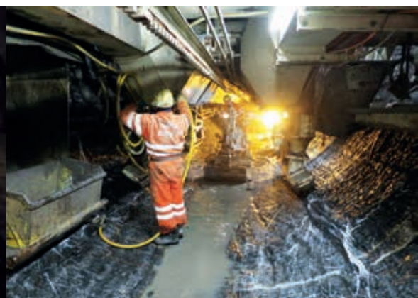
Die frisch ausgefräste Tunnelröhre wird gereinigt, bevor die Betonelemente verlegt werden.