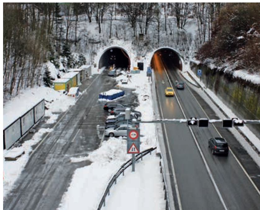
Keine Winterpause: Im Rugentunnel wurde die Sanierung der Nordröhre (links im Bild) im Winter weitergeführt.

Seit dem Frühjahr 2014 sind die Arbeiten zur Sanierung der Lüttschinenunterführung und des Rugentunnels im Gang. Ziel ist die Erhaltung der Bauwerke für die Zukunft sowie die Optimierung der Tunnelsicherheit. Die Arbeiten sind im Zeitplan. In der Lüttschinenunterführung geht die Winterpause in den nächsten Tagen zu Ende. Im Rugentunnel wurde über den Winter durchgearbeitet.